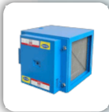
Electrostatic Air Cleaners (UL Series)