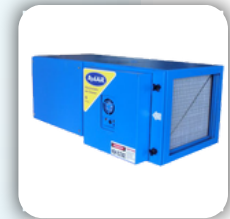
Electrostatic Air Cleaners (With Motor and Blower)