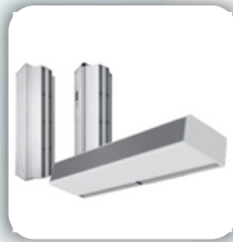
Industrial Air Curtains