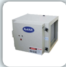
Low Capacity Electrostatic