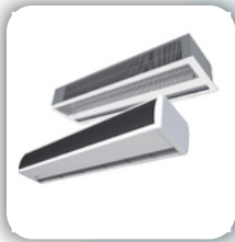
Commercial Air Curtains