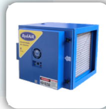
Electrostatic Air Cleaners (Without Blowers)