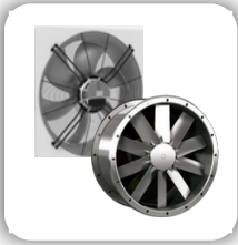
Axial Fans /Smoke