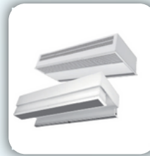
Recessed/ Revolving Doors Air Curtains