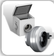
Inline Ducted Fans