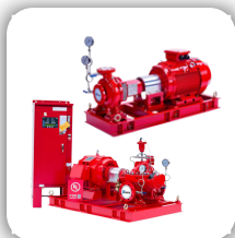
Fire Pump Set NMFiRE