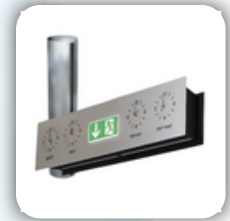
Decorative Air Curtains